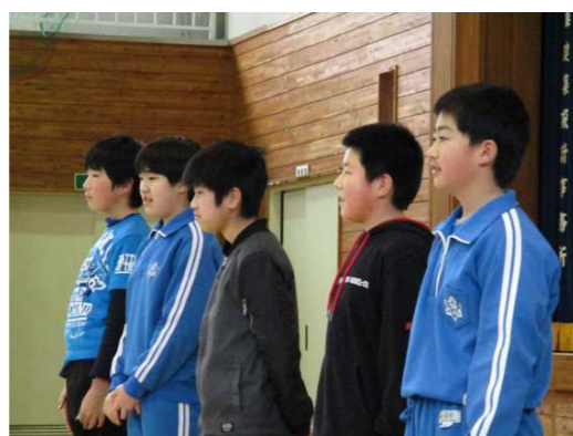
横田小学校の顔5名の6年生です。