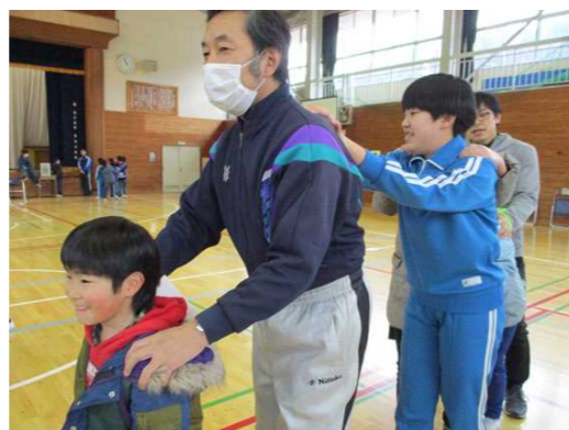
ゲーム「じゃんけん列車」も盛り上がりました。